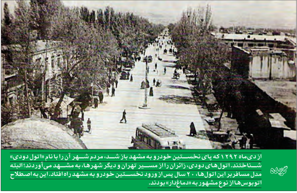
از دی‌ماه ۱۲۹۲ که پای نخستین خودرو به مشهد باز شد، مردم شهر آن را با نام «اتول دودی» شناختند. اتول‌های دودی، زائران را از مسیر تهران و دیگر شهرها، به مشهد می‌آوردند؛ البته مدل مسافربری این اتول‌ها، ۲۰ سال پس از ورود نخستین خودرو به مشهد راه افتاد. این به اصطلاح اتوبوس‌ها از نوع مشهور به «دماغ‌دار» بودند.

از نظر شاسی و فنرها و هم شرایط بسیار ناگوار جاده‌هایی بود که هرچند اسمشان را «شوسه» گذاشته بودند، اما در حد جاده‌های «مال‌رو» قدیم می‌شد از آن‌ها انتظار داشت؛ نخستین اتول دودی‌هایی که زائران را به مشهد می‌آوردند، از نوع «ماشین سیمی» بودند؛ نوعی خودرو