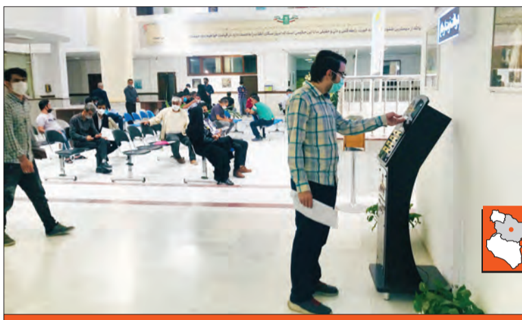
اگر نوبت دهی به شکات هم به صورت الکترونیکی صورت بگیرد و افراد در تاریخ و زمان تعیین شده برای طرح شکایت به نواحی دادرسی عمومی و انقلاب مشهد مراجعه کنند، می توانند میزان این رضایت مندی را به مراتب بیشتر کنند.

شکات همان ابتدا به کلانتری های محل هدایت نمی شوند و از رفت و آمدهای بی مورد جلوگیری می شود؛ چرا که چندین قاضی ارجاع در محل حضور دارند و به محض ورود شکایت، مستندات پرونده بررسی و در صورت قابلیت طرح پرونده در دادرسی پرونده به شعبات ارجاع شده و در غیر آن