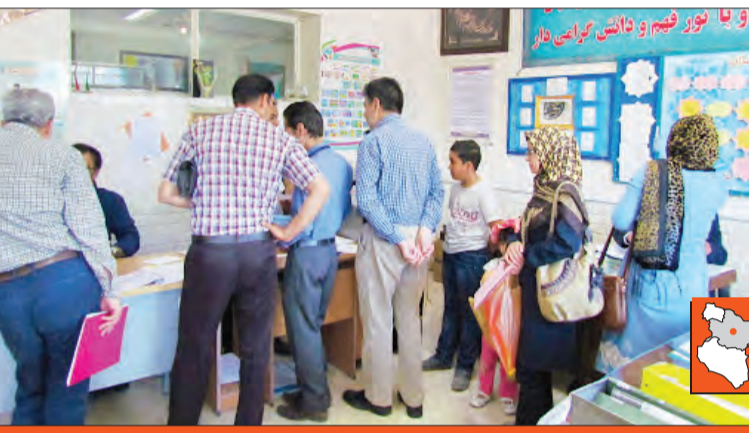
با شیوع ویروس کرونا وزارت آموزش و پرورش به استان‌ها ابلاغ کرد شرایط و بستر انجام خدمات مورد نیاز را به صورت الکترونیکی و مجازی فراهم کنند اما تا امروز این کار انجام نشده و ما مجبوریم چوب کوتاهی‌های صورت گرفته را بخوریم. اگر این امکانات ایجاد شده بود نیاز نبود تمامی افراد همزمان به محل کار بیایند.

وزارت آموزش و پرورش به استان‌ها ابلاغ کرد شرایط و بستر انجام خدمات مورد نیاز را به صورت الکترونیکی و مجازی فراهم کند اما تا امروز این کار انجام نشده و ما مجبوریم چوب کوتاهی‌های صورت گرفته را بخوریم. اگر این امکانات ایجاد شده بود نیاز نبود تمامی افراد همزمان به محل کار بیایند.