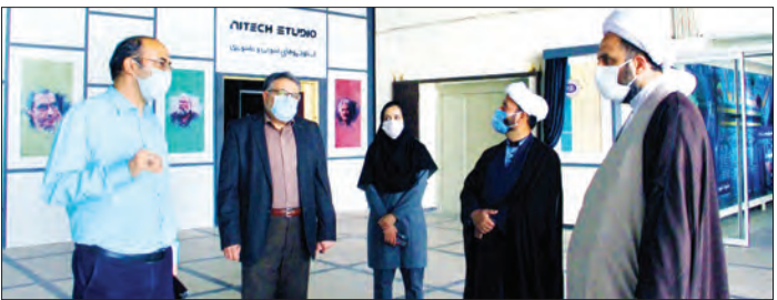
معاون تبلیغات اسلامی آستان قدس رضوی خواستار شد