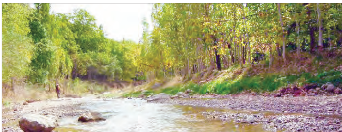
سفر به ۴۵ کیلومتری شمال شرق مشهد