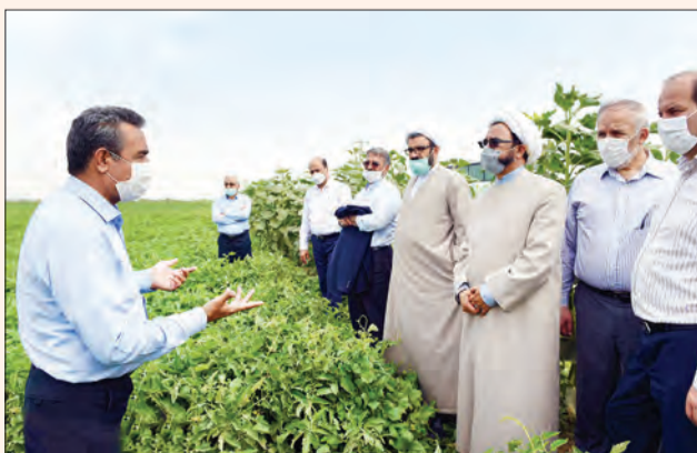
وی با بیان اینکه بخش قابل توجهی از موقوفات اعتبار مقدس، شامل زمین‌های زراعی و باغات است، افزود: