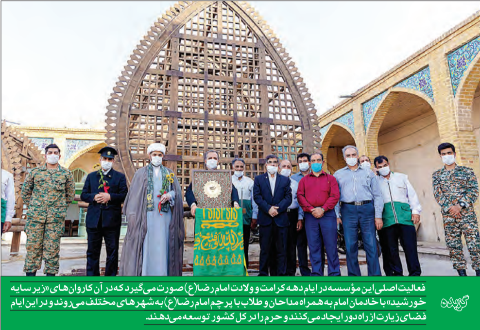
فعالیت اصلی این مؤسسه در ایام به‌کرامت و ولادت امام رضا (ع) صورت می‌گیرد که در آن کاروان‌های «زیر سایه خورشید» با خادمان امام به همراه مداحان و طلاب با پرچم امام رضا (ع) به شهرهای مختلف می‌روند و در این ایام فضای زیارت از راه دور ایجاد می‌کنند و حرم را در کل کشور توسعه می‌دهند.