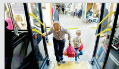
نیز در ایستگاه‌های بین مسیر خطوط نسبت به ارشاد مسافران فاقد ماسک اقدام می‌کنند و رعایت دستورالعمل‌های بهداشتی در ناوگان

تشدید شده است. تمامی ناوگان سازمان اتوبوسرانی در ابتدا و انتهای خطوط صدقوفنی می‌شود و در ناوگان، ایستگاه‌ها و پایانه‌ها اطلاع‌رسانی درباره فاصله‌گذاری اجتماعی انجام شده است. مدیرعامل سازمان اتوبوسرانی شهرداری مشهد خاطرنشان کرد: روزانه بیش از هزار و ۵۰۰ تست غربالگری کارکنان نیز توسط چهار تیم در سازمان متشکل از کارکنان به همراه پرسنل مرکز فوریت‌های پزشکی مشهد انجام می‌شود.