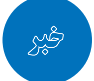
فرمانده انتظامی خراسان رضوی

شوند و در بازرسی از مخفیگاه آنان، چهار دستگاه ماینر کشف و ضبط شد. فرمانده انتظامی خراسان رضوی تأکید کرد: سارقان مسلح به سرقت از چهار کارگاه تولید رمزارز و سرقت بیش از ۱۰۰ دستگاه ماینر اعتراف کردند که منجر به دستگیری چهار مالخر و دو نفر دیگر از سارقان شد.