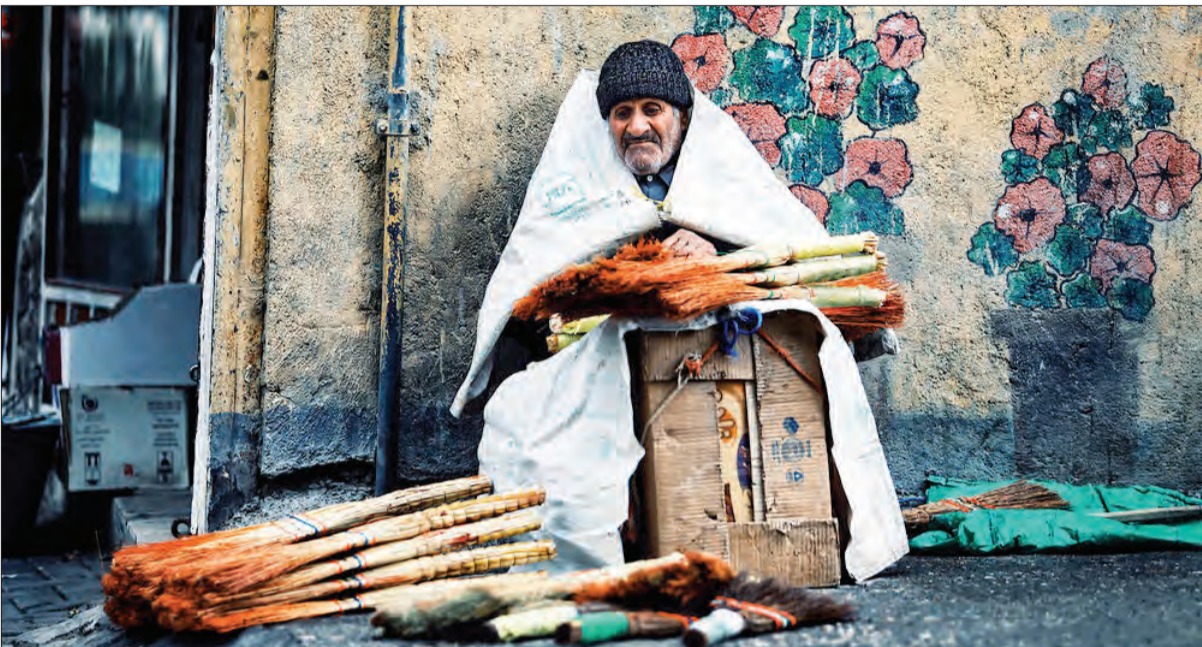
افزایش جمعیت سالمندی به معنای افزایش امید به زندگی، افزایش بهداشت، رفاه و مراقبت از سالمندان است و افزایش جمعیت سالمندان اتفاق بسیار خوبی است، اما موضوع نگران کننده کاهش نرخ باروری است که موجب می‌شود در آینده با کمبود نیروی فعال و سازنده مواجه شویم و این پیری جمعیت، آینده اقتصاد و اشتغال را تهدید می‌کند.

اعظم طبرانی | قرار است افزایش جمعیت سالمندان به معنای افزایش امید به زندگی، افزایش بهداشت، رفاه و افزایش مراقبت از سالمندان باشد و به همین دلیل است که حسن موسوی چلک، رئیس انجمن مددکاری ایران می‌گوید افزایش جمعیت سالمندان اتفاق بسیار خوبی است.