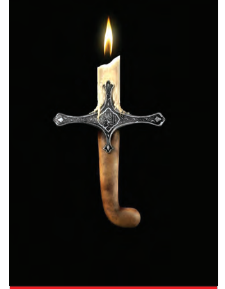
خیانت عبیدالله حتی با رسوم عرب هم سازگار نیست؛ چرا که اعراب معمولاً در مورد خاندان خود، تعصب داشتند و از آن ها حمایت می کردند.

سبب شده بود تا تردیدی در دشمنی وی با آل امیه و معاویه وجود نداشته باشد؛ اما زمانی که امام علی (ع) به شهادت رسید و خلافت امام حسن (ع) آغاز شد، وضع به طرز عجیبی تغییر کرد. امام مجتبی (ع) با تلاش فراوان، لشکری ۱۲ هزار نفری را برای نبرد با شامیان مهیا کرد و فرماندهی آن را به عبیدالله بن عباس سپرد و قیس بن سعد را جانشین وی قرار داد. معاویه ابتدا سعی کرد قیس را که مردی جنگاور و شجاع بود با رشوه یک میلیون درهمی فریب دهد؛ اما قیس پاسخ منفی داد. معاویه این پیشنهاد را برای عبیدالله بن عباس فرستاد و در کمال شگفتی، او نه تنها پذیرفت که به امام مجتبی (ع) خیانت کند و به معاویه بپیوندد، بلکه ۸ هزار نفر از لشکریان امام (ع) را هم که تحت فرمانش بودند، با خود به