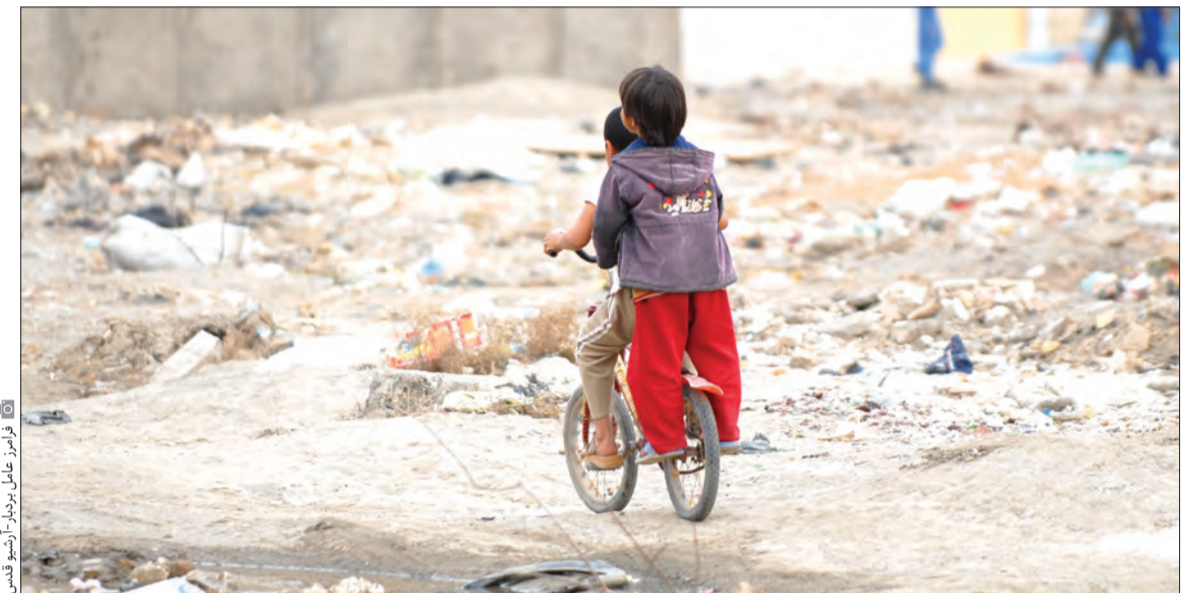
مدیران شهری در قبال نیازهای جامعه، خودشان را به روز نکرده‌اند و تا آنجا که اطلاع داریم برنامه خاصی برای مقابله با حاشیه‌نشینی در دست اجرا نیست و با این امر که مثلاً سالی ۵۰۰ هزار یا یک میلیون واحد مسکونی حداقل ۶۰ تا ۸۰ متری در کشور ساخته شود بسیار بعید است حاشیه‌نشینیان بتوانند صاحب مسکن شوند و حاشیه‌نشینی کم شود.

زمینه اشتغالش را فراهم کنیم تا درآمد ثابتی کسب کند و بتواند فرزندانش را به مدرسه بفرستد در این صورت خانواده‌ها خودشان محله را آباد می‌کنند و توسعه درون‌زای محلات اتفاق می‌افتد.