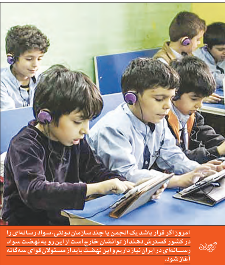
امروز اگر قرار باشد یک انجمن یا چند سازمان دولتی، سواد رسانه‌ای را در کشور گسترش دهند از توانشان خارج است از این رو به نهضت سواد رسانه‌ای در ایران نیاز داریم و این نهضت باید از مسئولان قوای سه‌گانه آغاز شود.

چون آن‌ها هم سواد رسانه‌ای ندارند و انتشار این اخبار غلط موجب بی‌اعتمادی مردم می‌شود. تعداد مخاطبان یک رسانه اهمیتی ندارد، مهم این است که چقدر به آن رسانه اعتماد دارند. وقتی خبر دروغی منتشر می‌شود، اعتماد مخاطب خدشه‌دار می‌شود و اگر آن رسانه خبر درستی هم منتشر کند مخاطبان به دیده تردید به آن می‌نگرند. انتشار اخبار کذب از تهدیدهای جدی رسانه‌های رسمی است و این نشان‌دهنده فقدان سواد رسانه‌ای در مدیریت آن رسانه و خبرنگارانش است. امروزه در جهان داده‌ها و اطلاعات بایستی مجهز به دانش مدیریت اطلاعات درست بود به همین دلیل دروازه‌بانی اخبار و اطلاعات بسیار بااهمیت است. در چنین شرایطی نیاز به بازنگری و ارتقای سواد رسانه‌ای مسئولان و مردم داریم.