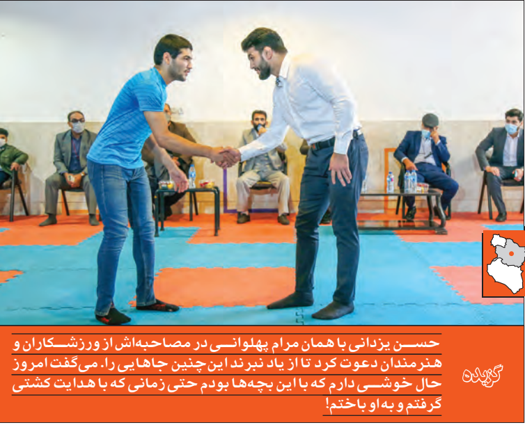
حسن یزدانی با همان مرام پهلوانی در مصاحبه‌اش از ورزشکاران و هنرمندان دعوت کرد تا از یاد نبرند این چنین جاهایی را. می‌گفت امروز حال خوشی دارم که با این بچه‌ها بودم حتی زمانی که با هدایت کشتی گرفتیم و به او باختیم!

درخواست را اما پنجه در پنجه شد با هدایت. علم به یقین جهان‌پهلوان با اولین حرکت هدایت را ضربه فنی می‌کرد همان طور که همین چند وقت پیش تیلور آمریکایی را به تشک مسابقات جهانی دوخت! اما جوانمردانه ضربه شد تا دل هدایت را بدست آورد. شیر مادر و نان پدر حالات پهلوان حسن وقتی برابر پرسش خبرنگاران از قهرمانی در میادین جهانی و المپیک تا ضربه شدن مقابل هدایت قرار گرفتی خود را کمترین خطاب کردی جلومردم. جهان‌پهلوان، همچنان که در میدان رقابت به