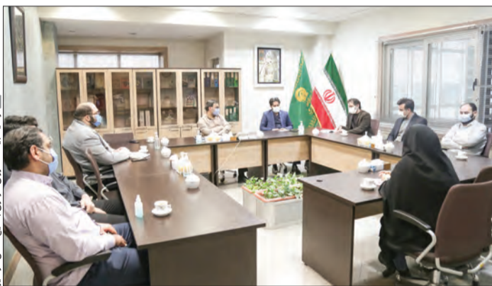
توسط رئیس شورای هماهنگی تبلیغات اسلامی خراسان رضوی