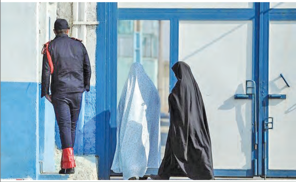
از آرزوی این مادر می‌پرسم و می‌گویم: «از خدا می‌خواهم حالا که کمک کرده آزاد شوم، کار پیدا کنم، آرزوی دیگرم هم این است که به همین زودی‌ها به پابوسی امام هشتم مشرف شوم چون ۱۰ سال است که مشهد نیامدیم و حالا که آزادی‌ام را از ایشان گرفتم، امیدوارم آقا باز هم ما را بطلبند».

به‌خاطرات روزهای زندان که برمی‌گردد، از شکل متفاوت توسلش به ساحت اهل بیت(ع) می‌گوید: «اوایل ماه محرم به زندان افتادم. یک روز که به یاد اوضاع پریشان همسر و فرزندانم بودم، دلم خیلی شکست و با توسل به امام حسین(ع) تصمیم گرفتم از روی پوستری از عکس عصر عاشورای استاد فرشچیان، طرحی روی دیوار زندان بکشم. یکی از روزها از دلم گذشت که «یا امام رضا(ع) تو که ضامن آهویی، ضامن من شو تا آزاد شوم. چیزی نگذشت که به من خبر دادند همه بدهی‌ام را یک خیر به نیت امام هشتم پرداخته و می‌توانم به خانه برگردم».