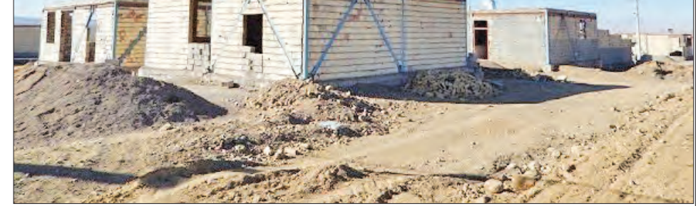
ساخت ۴۰ واحد مسکونی ویژه محرومان سرخس

مورد نیاز محرومان اقدام شود. او ادامه می‌دهد: در این راستا با هماهنگی کمیته امداد اراضی مذکور جانمایی شده و هم‌اکنون نیز این نهاد در مرحله تأمین اعتبار برای ساخت مسکن‌های مربوطه است.