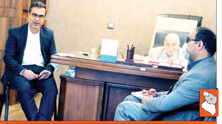
هر بیمار کلیوی در سال چیزی حدود ۱۸۰ میلیون تومان برای انجام دیالیز به‌مراکز خصوصی پرداخت می‌کند اگر تنها در یک سال ۳۰۰ نفر از آن‌ها پیوند شوند نزدیک به ۵۵ میلیارد تومان از درآمد آن‌هایی کسر می‌شود که گفته شده تعارض منافع با این اقدام دارند پس مقاومت می‌کنند و اجازه نمی‌دهند این انحصار از آن‌ها گرفته شود.

عمل پیوند در مشهد به سرانجام رسیده که باید گفت هیچ‌گونه بوده است. نکته دیگر اینکه در مشهد تنها یک بیمارستان داریم که در آن پیوند کلیه انجام می‌شود این یعنی انحصار. انحصار که وجود داشته باشد برای دست‌اندرکاران و آن‌هایی که در کمیسیون پزشکی هستند قدرت می‌آورد و نتیجه عدم تأیید برای پیوند این است که مشکلات برای