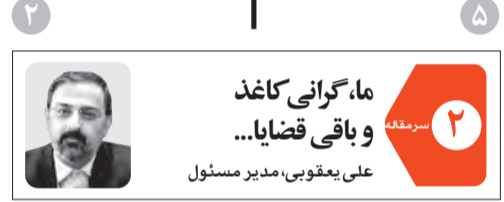
ما، گرانی کاغذ و باقی قضایا... علی یعقوبی، مدیر مسئول