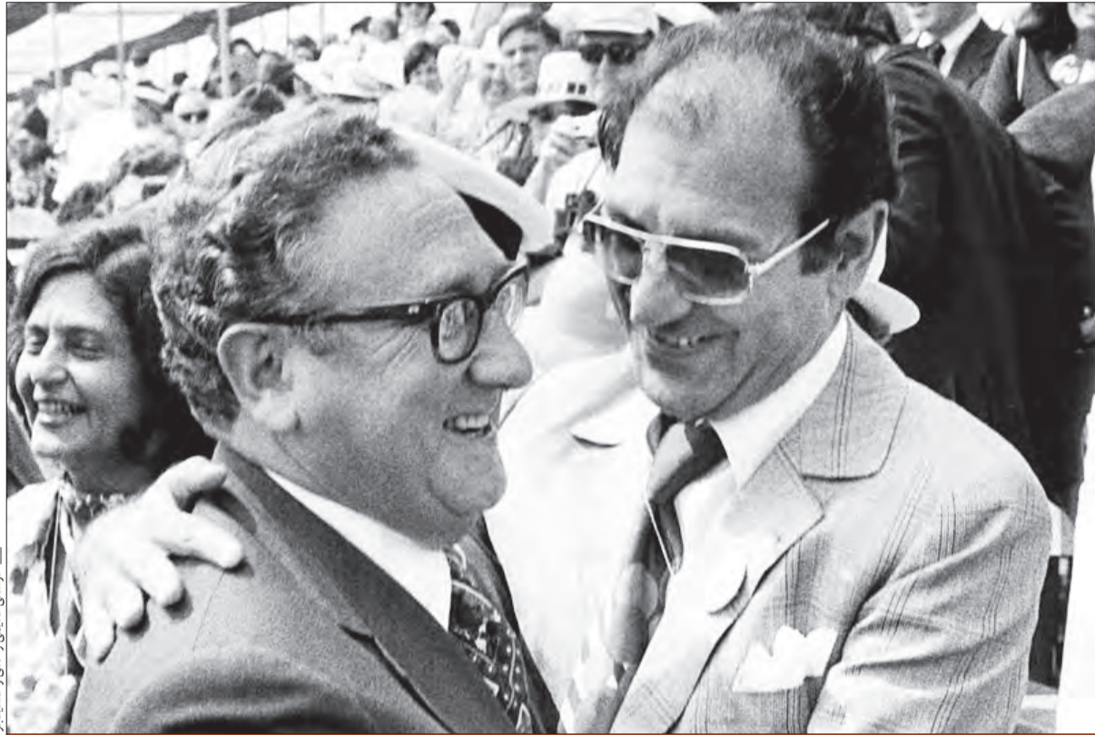
اردشیر زاهدی در دوره‌ای موجب سلب مشرو و عیت بنیادی و اساسی از رژیم پهلوی شد که شاعر «رضاشاه روح‌شاد» داده می‌شد. با موضع‌گیری زاهدی در باره شهادت حاج قاسم، افرادی که نگاه احتیاط‌آمیز داشتند این احتیاط را کنار گذاشتند و برای سردار سلیمانی موضع گرفتند.

جناب آقای بختیاری منش، بفرمایید نخستین آشنایی شما با آقای اردشیر زاهدی از کجا و در چه زمانی بود؟ من از سال ۱۳۹۴ که پروژه تاریخ شفاهی را شروع کردم، به واسطه یکی از دوستان با آقای اردشیر زاهدی آشنا شدم. آن زمان ایشان خیلی نسبت به رژیم گذشته تعصب و از جمهوری اسلامی هم نفرت زیادی داشت. طبعاً کسی که در یک حکومت مسئولیت کلانی داشته، نمی‌تواند نسبت به رژیمی که آن حکومت را براندازی کرده، دلبستگی داشته باشد. او احساسات ناسیونالیستی و علاقه به کشور داشت. در واقع مثل خیلی از رجال سیاسی نبود که بگوید حالا که من دیگر در این کشور نیستم، پس هر چه با‌ا باد.