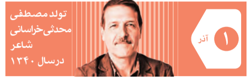
تولد مصطفی محدثی خراسانی شاعر درسال ۱۳۴۰