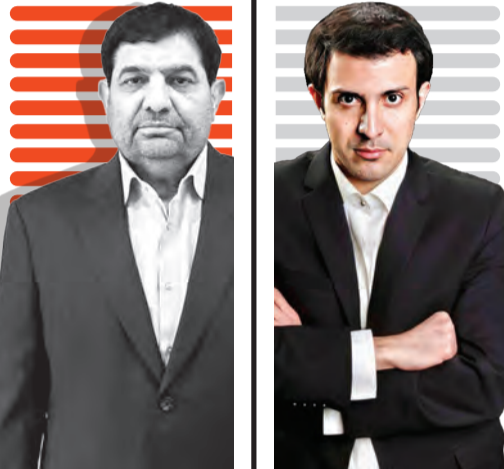
مخبر در آیین افتتاح ۲۵۵۰ طرح محرومیت‌زدایی سازمان بسیج: ارز ترجیحی برای کشور مفید نیست گفت‌وگو با کسی که از تهران مواضع اردشیر زاهدی را تغییر داد: اپوزیسیون علیه اپوزیسیون