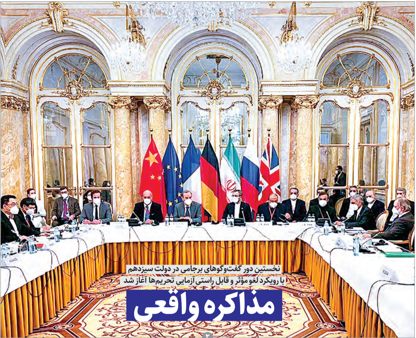
نخستین دور گفت‌وگوهای برجانی در دولت سیزدهم با رویکرد لغو مؤثر و قابل راستی آزمایشی تحریم‌ها آغاز شد