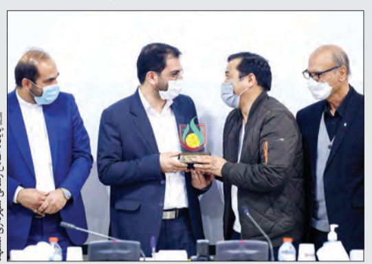
پایگاه اطلاع رسانی شهرداری مشهد

شهردار مشهد در مراسم تجلیل از حماسه ساز ملبورن: خداداد سمت مردم ایستاد شهردار مشهد از سالروز بازی تاریخی ایران - استرالیا که دیروز در سالن شهدای شهرداری و با حضور عزیزی، جمعی از پیشکسوتان فوتبال خراسان، اعضای شورای شهر و هیئت فوتبال و تنی چند از اصحاب رسانه برگزار شد، ارجاعی رمز ماندگاری نام خداداد در فوتبال ایران و آسیا را ایستادن او در سمت مردم عنوان کرد و به مسئولان هیئت فوتبال پیشنهاد داد به پاس زحمات عزیزی و گل تاریخی اش که باعث ایجاد و شور و نشاط اجتماعی بین مردم شد ۸ آذر را «روز فوتبال خراسان» نام گذاری کنند. ناصحی نایب رئیس شورا هم خداداد را از مفاخر شهر خواند که در فوتبال ملی مایه مباحث مشهدی هاست و باید بیشتر از این قدر و منزلت ببیند.