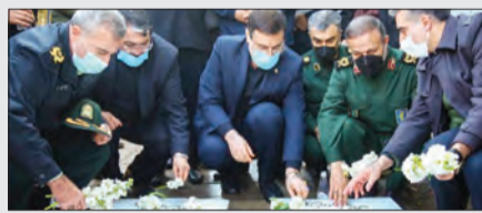
مراسم گلباران مزار شهدا و گرامیداشت دومین سالگرد شهدای سقوط هواپیمای اوکراینی

مراسم گلباران مزار شهدا و گرامیداشت دومین سالگرد شهدای سقوط هواپیمای اوکراینی صبح جمعه ۱۶ دی‌ماه با حضور رئیس بنیاد شهید در گلزار شهدای بهشت زهرا(س) برگزار شد. سید امیرحسین قاضی‌زاده هاشمی در این مراسم گفت: تاکنون از ۱۳۳ خانواده ایرانی این واقعه، پرونده ۷۳ خانواده معزز تشکیل شده و درباره سایر خانواده‌ها نیز آمادگی برای تشکیل پرونده و ارائه خدمات وجود دارد. وزارت امور خارجه کشورمان نیز روز گذشته اعلام کرد: تحقیقات کیفری سانحه هواپیمای اوکراینی با تأکید بر عدالت انجام شده است.