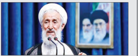
حجت‌الاسلام‌والمسلمین کاظم صدیقی

حجت‌الاسلام کاظم صدیقی در خطبه‌های نماز جمعه پایتخت گفت: پس از شهادت شهید سلیمانی، آب‌خوش از گلوی آمریکایی‌ها پایین نخواهد رفت. به گزارش فارس، امام جمعه موقت تهران افزود: امروز صلابت و اقتدار مجاهدان عراق، لبنان و یمن را می‌بینیم و در افغانستان هم پس از شهادت حاج قاسم بود که آمریکا با سرافکنندگی گوش‌راگم کرد. وی افزود: بعد از شهادت سردار سلیمانی، وعده انتقام سر داده شد و در چنین روزی عین‌الاسد را در هم کوبیدند و دشمنی که هیچ آبرویی برایش نمانده، غلطی نتوانست بکند.