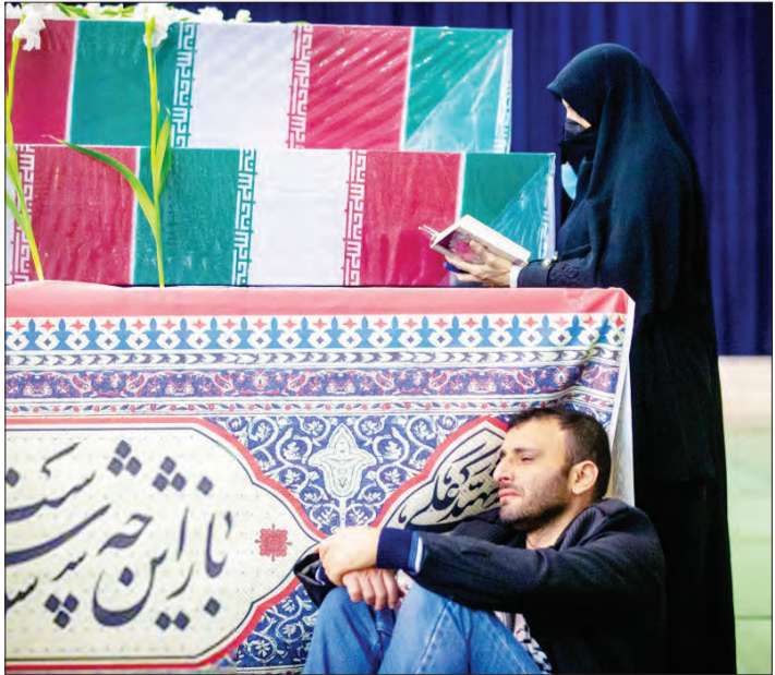
مراسم وداع با ۱۵۰ شهید گمنام دفاع مقدس