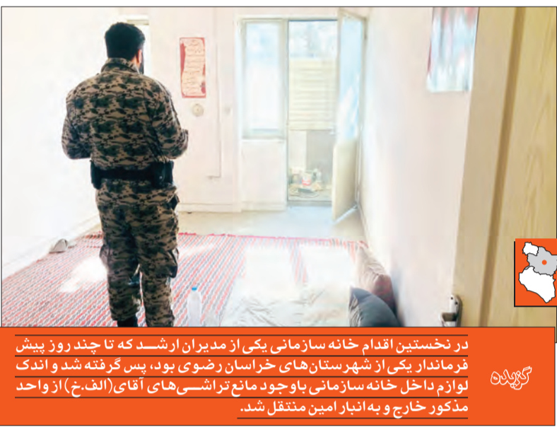
در نخستین اقدام خانه سازمانی یکی از مدیران ارشد که تا چند روز پیش فرماندار یکی از شهرستان‌های خراسان رضوی بود، پس گرفته شد و اندک لوازم داخل خانه سازمانی با وجود مانع تراشی‌های آقای (الف.خ) از واحد مذکور خارج و به انبار امین منتقل شد.

در آن زمان فقط توانستیم به اطلاعات خامی دست پیدا کنیم که نشان می‌داد بیش از ۲۵ مدیر استانی که ادعای خدمت به مردم را داشته و برخی هم همچنان دارند، با توجه به قدرت، نفوذ و رانندگی که داشتند، سال‌ها پیش خانه‌های سازمانی در بولوار فرامرزی عباسی مشهد را به پنهان چند سال سکونت که حق هر کارمند است تصاحب و پس از اتمام زمان سکونت با نگاه غیرشرعی و غیرقانونی نقشه مالک شدن واحدها را اجرا کردند. خانه‌هایی که ارزش مادی آن اکنون میلیاردها تومان است. پرس‌وجوها حاکی از آن بود که مجتمع ۴۸ واحدی که در محل وجود دارد و متراژ هرکدام آن‌ها بالای ۱۰۰ متر است، مسئولانی مانند فرماندار یکی از شهرستان‌های خراسان رضوی، مدیران استانداری، افرادی از دادگستری، راه‌وشهرسازی استان و... ساکن هستند. همچنین در میان آن‌ها هستند مدیرانی که از سال ۱۳۸۴ یعنی ۱۵ سال پیش خانه‌ها را تحویل گرفته ولی پس از پایان مدت سکونت قانونی، هرگز فکر تخلیه خانه‌ها به سرشان نزده است.