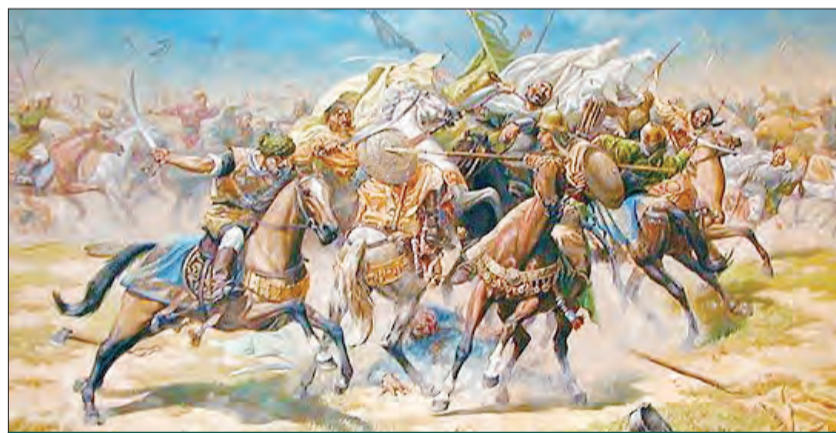
در آبان سال ۵۲۷ غزها دوباره به خراسان ریختند و این بار، وحشیانه‌تر از قبل به غارت و چپاول این منطقه پرداختند. خبر هجوم آن‌ها به سرخس و نواحی مجاور آن، خیلی زود به مشهد و روستاهای اطراف آن رسید و شهر و حرم مطهر، دوباره پراز جمعیت پناهندگان شد.

مشهد در این زمان، هنوز شهرکی آباد در کنار شهر بزرگ نوقان به حساب می‌آمد که به دلیل قرار داشتن مرقد مطهر امام رضا(ع)، مکانی مقدس و قابل احترام برای همه مسلمانان، اعم از شیعه و سنی بود. غزها که خود مدعی مسلمانی بودند و از این نظر باید میان آن‌ها و مغولان فرق قائل شویم، ظاهراً از نزدیک شدن به مشهد و غارت آن، ابا داشتند. اما براساس گزارش مورخانی مانند ابن‌اثیر، در کتاب «الکامل فی التاریخ»، روستا و شهری در اطراف مشهد باقی نماند که از تعرض آن‌ها مصون باشد. غزها به تیلگرد(تلگرد