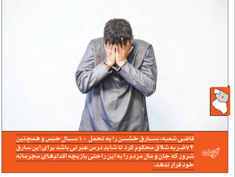
قاضی شعبه، سارق خشن را به تحمل ۱۰ سال حبس و همچنین ۷۴ ضربه شلاق محکوم کرد تا شاید درس عبرتی باشد برای این سارق شرور که جان و مال مردم را به این راحتی باز چیه اقدام‌های مجرمانه خود قرار ندهد.

و قضایی شرح شکایت کرد، اما باز هم آن روز دست خالی راهی خانه شد. چند روز از سرقت گذشت که مأموران کلانتری آبکوه حین گشت‌زنی در حوالی خیابان فدک به راکب یک دستگاه موتورسیکلت که پلاک محدودی روی آن نصب بود، مشکوک می‌شوند.