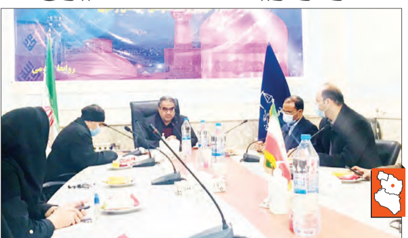
مدیرکل تعزیرات حکومتی: از ابتدای سال جاری تا ۲۸ دی ماه حدود ۴۴ هزار پرونده تخلف برای افراد تشکیل و به شعبه‌های تعزیرات حکومتی استان ارجاع شده است. از این آمار بیش از ۳۴ هزار پرونده به حوزه کالا و خدمات مربوط و بیش از ۴ هزار پرونده در خصوص بهداشت و درمان و مابقی هم قاچاق کالا و ارز بود.

در این کمیته طرح تشدید نظارت‌ها با همراهی دیگر دستگاه‌های متولی پیگیری و مشکلات واحدهای تولیدی مرتفع می‌شود و از سوی دیگر متخلفان نیز مورد شناسایی و برخورد قرار می‌گیرند.