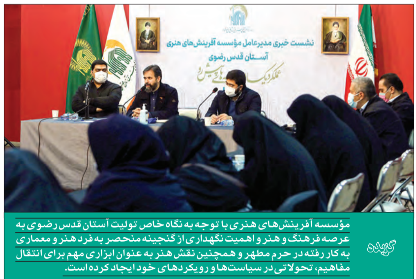
مؤسسه آفرینش‌های هنری با توجه به نگاه خاص تولید آستان قدس رضوی به عرصه فرهنگ و هنر و اهمیت نگهداری از گنجینه منحصر به فرد هنر و معماری به کار رفته در حرم مطهر و همچنین نقش هنر به عنوان ابزاری مهم برای انتقال مفاهیم، تحولاتی در سیاست‌ها و رویکردهای خود ایجاد کرده است.