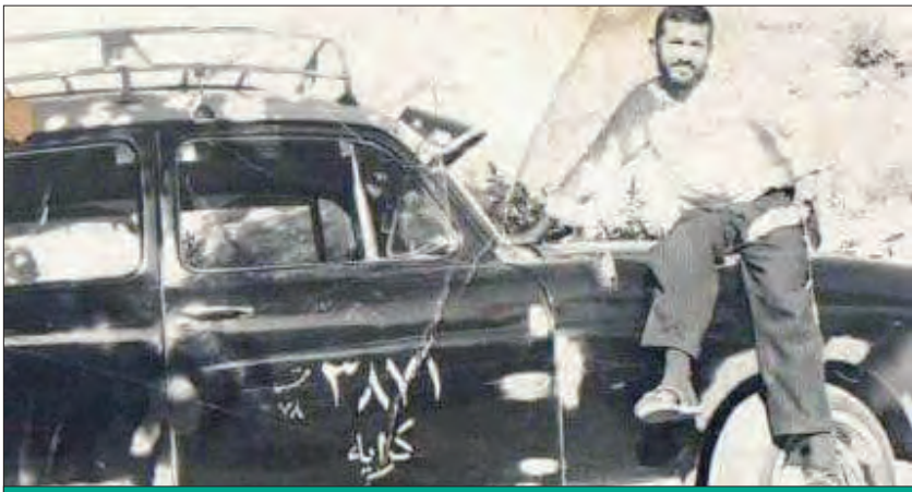
ورود تاکسی به فضای شهری مشهد به ویژه بخش ارائه خدمات به زائران حرم رضوی، بدون چالش نبود. درشکه‌چی‌ها که تعدادشان با وجود فعالیت تاکسی‌ها در شهر مشهد، هر روز بیشتر می‌شد، از ورود تاکسی به این عرصه بیمناک بودند.

بیشتری پیدا کرد و ساخت هتل‌ها و مهمانپذیرها در فاصله طولانی‌تری نسبت به حرم مطهر سبب می‌شد زائران اقبال بیشتری نسبت به تاکسی‌ها به ویژه در فصل زمستان داشته باشند. درشکه‌ها تا سال ۱۳۴۰ خورشیدی، یعنی حدود ۶۰ سال پیش، همچنان وسیله نقلیه غالب در مشهد بودند و تعدادشان در این سال به حدود ۳۲۰ دستگاه می‌رسید. در این سال و به ویژه پس از تأسیس فرودگاه و پس از آن راه‌آهن مشهد، نیاز به سامانه‌های ناوگان تاکسیرانی بیش از هر زمان دیگری به چشم آمد. این بود که شهرداری مشهد با مرکزیت فلکه حضرتی، سازمان تاکسیرانی مشهد و حومه را تأسیس کرد و همه تاکسی‌های مشهد را که در آن زمان، رنگ‌های متنوع و مدل‌های مختلفی داشتند، تحت نظم و نظام ویژه‌ای درآورد و برای آن‌ها هم رنگ زرد را انتخاب کرد. در نیمه نخست دهه ۴۰،