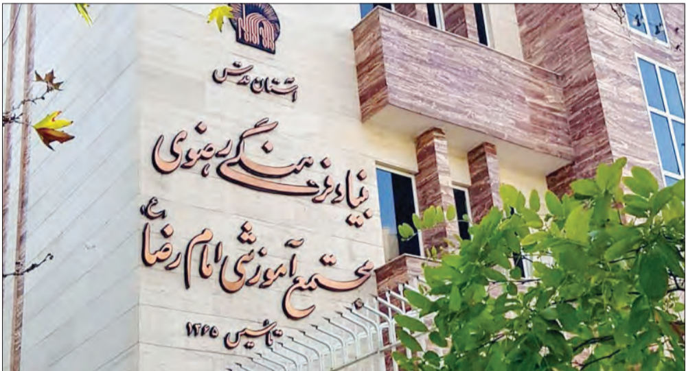
پس از انقلاب علمی در دنیا، نظام یادش، تنبیه، انگیزشی و مفاهیمی از این قبیل شکل گرفت. در تربیت دینی هم ما همین مقوله ها را داریم، اما این مفاهیم در آمیخته با مضامین و مفاهیم دینی است.

مذهبی دانش آموزی داریم و به بیان نقش آفرینی آنان می پردازیم. مراسم دینی و شعائر اسلامی، مورد توجه ویژه این مدارس است و تلاش می کنیم با فراهم