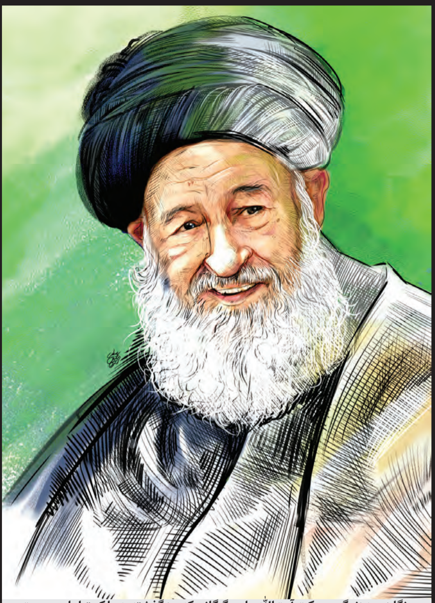
نگاهی به زندگی پربرکت آیت‌الله علوی گرگانی که روز گذشته به ملکوت اعلی پیوست