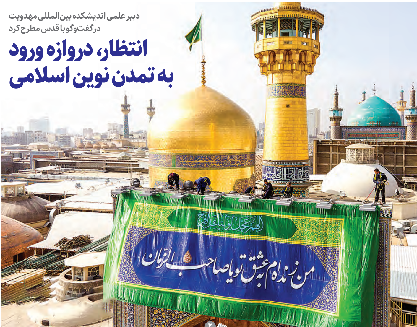
مصطفی شیرزایی