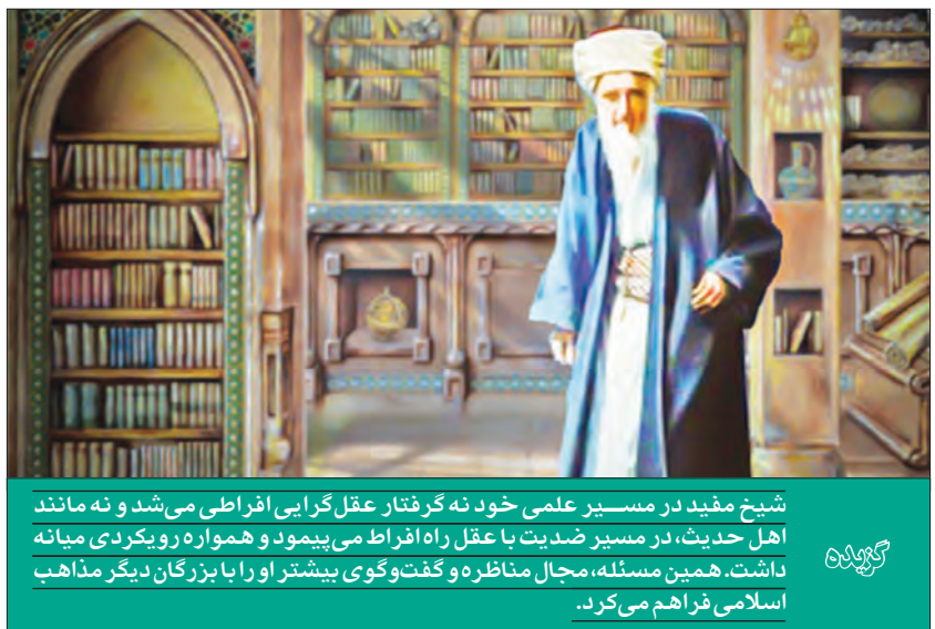
شیخ مفید در مسیر علمی خود نه‌گرفتار عقل‌گرایی افراطی می‌شد و نه مانند اهل حدیث، در مسیر صِدیت با عقل راه افراط می‌پیمود و همواره رویکردی میانه داشت. همین مسئله، مجال مناظره و گفت‌وگوی بیشتر او را با بزرگان دیگر مذاهب اسلامی فراهم می‌کرد.

علم فقه و «اوائل المقالات» در دانش کلام از جمله معروف‌ترین آثار شیخ محسوب می‌شوند که هنوز در مراکز علمی جهان کاربرد و مراجعه فراوانی دارند. شیخ مفید را پس از درگذشت، ابتدا در خانه‌اش دفن کردند و چندی بعد چنان که نجاشی در کتاب «رجال» خود آورده است به کاظمین انتقال دادند و در جوار حرم مطهر امام موسی کاظم(ع) و امام جواد(ع) به خاک سپردند.