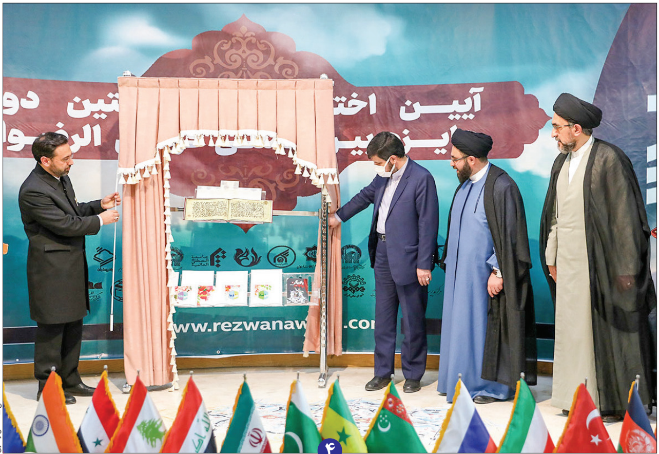
حجت الاسلام محمدحسین عسکری رضوی