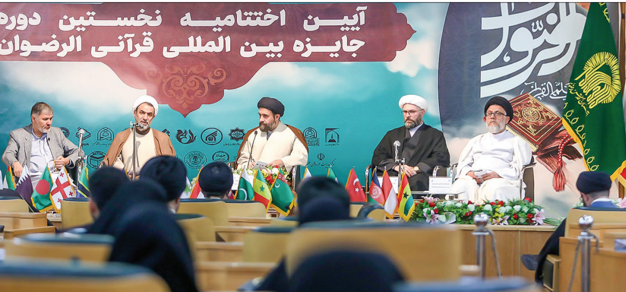
مشکل امروز جهان اسلام این است که از ظرفیت قرآن به درستی بهره نبرده ایم، در حالی که طبق فرموده پیامبر اکرم (ص) اهل بیت (ع) را داشته باشیم، هیچ بنیستی در زندگی نخواهیم داشت. اگر ما در جهان اسلام به معنای واقعی کلمه، به این حدیث پیامبر (ص) جامه عمل ببوشانیم و همه چیز را با قرآن و اهل بیت (ع) محک بزنیم، دیگر با مشکلاتی مانند انحرافات فکری مواجه نخواهیم بود.