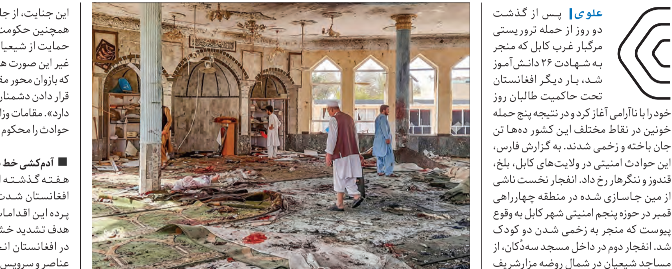
خط نفاق انگلیسی-آمریکایی که با اخراج مفتضحانه سال گذشته نظامیان آمریکایی و ناتو از افغانستان پس از ۲۰ سال اشغالگری دست خود را از این کشور کوتاه می‌بیند، در ادامه سیاست‌های خصمانه خود تلاش می‌کند با تداوم تفرقه‌افکنی همچنان سایه شوم خود را در این منطقه حفظ کند.

کابل نیز در اعتراض به حملات تروریستی اخیر علیه شیعیان افغانستان راهپیمایی و این حملات را محکوم کردند. معترضان در جریان راهپیمایی شعارهایی چون «هزاره‌بودن جرم نیست، امنیت ما را تأمین کنید»، «ما عدالت می‌خواهیم» و... را سر دادند.