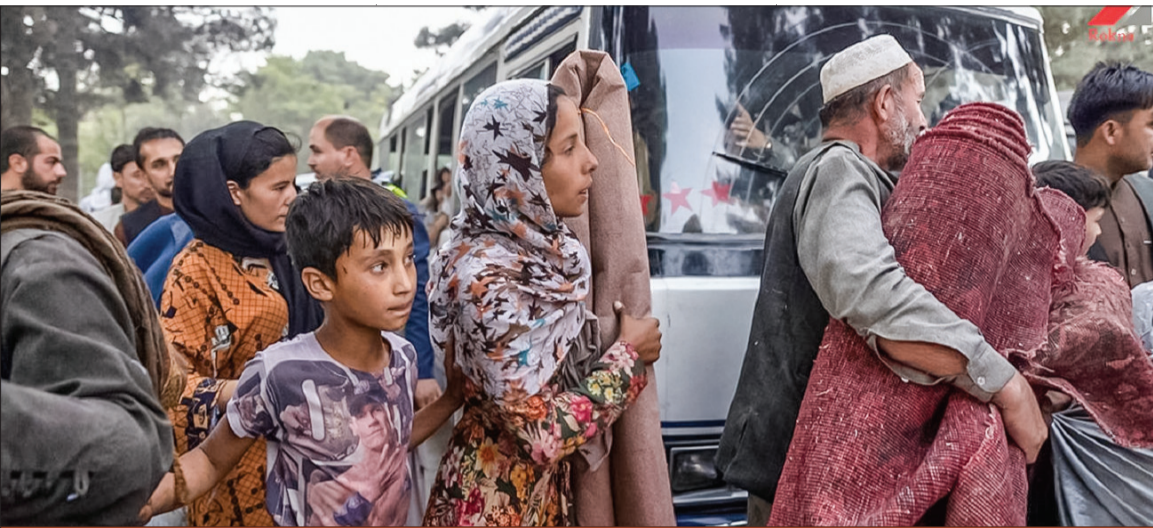
افغانستانی‌هایی که به صورت غیرقانونی از مرزهای نیمروز، تایباد و سایر مرزهای مشترک، خود را به ایران می‌رسانند معمولاً بین ۸ تا ۱۲ میلیون تومان به قاچاقچیان انسان پول می‌دهند.