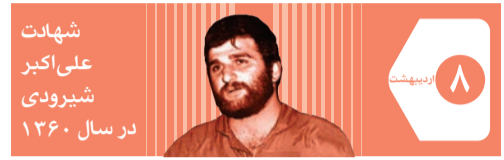
شهادت علی اکبر شیروندی در سال ۱۳۶۰