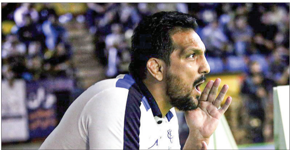
سرمربی تیم ملی کشتی آزاد در جمع خبرنگاران