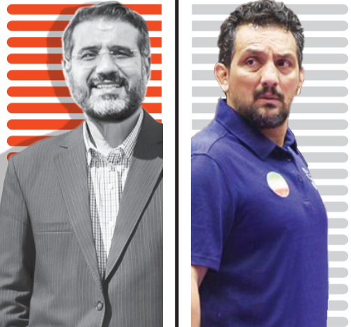
سرمربی تیم ملی کشتی آزاد در جمع خبرنگاران: به جوانان میدان دادیم و نتیجه گرفتیم