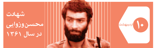
شهادت محسن وزوایی در سال ۱۳۶۱