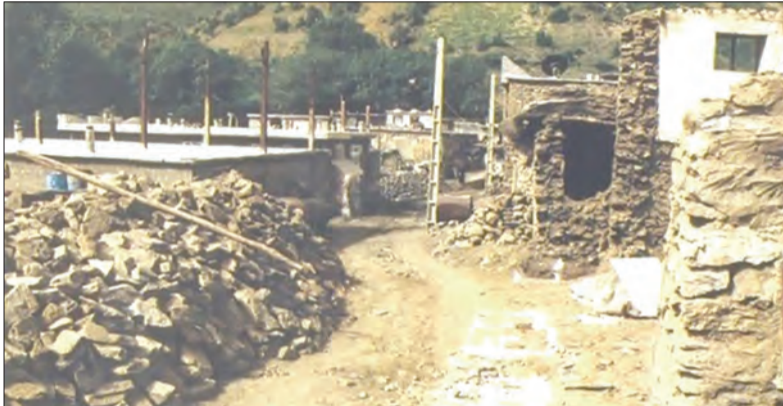
نمایی از روستای دوله تو و مکانی که قبلاً، زندان در آن قرار داشت

افراد بازداشت‌شده، اعم از نیروهای ارتش، سپاه پاسداران، پیش‌مرگه‌های کرد و مهندسان و کارکنان جهاد سازندگی را به این مکان منتقل می‌کردند. به گمان ضدانقلاب، موقعیت جغرافیایی دوله‌تو و قرار داشتن آن در ناحیه کوهستانی، باعث نفوذناپذیری این محل می‌شد. بر همین اساس، آن‌ها دست به ایجاد تأسیسات گوناگون نظامی و رفاهی برای خودشان در دوله‌تو زده بودند؛ از جمله ساختمان بسیار مجهز و شیک که برای سرکردگان گروهک دموکرات، مانند عبدالرحمن قاسملوساخته شد.