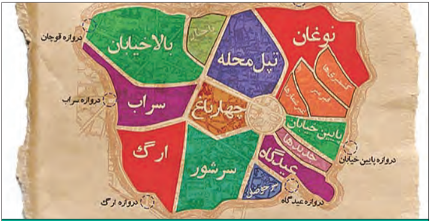
تا پیش از جا افتادن نقشه‌کشی‌های مدرن، بخشی از بار شناسایی منطقه و ارائه گزارش جغرافیایی درباره آن به عهده متنی بود که توسط جغرافیدان یا هر فرد مسلط دیگری نوشته می‌شد؛ متنی که از منظر توصیفی می‌کوشید با دقیق‌ترین شکل ممکن، نمای حقیقی شهر یا منطقه را پیش روی خواننده قرار دهد.

با تربیت مهندسان جوان ایرانی در اروپا و همچنین در مدرسه دارالفنون، به تدریج کار نقشه‌برداری از راه‌ها، شهرها و حتی مکان‌هایی مانند حرم مطهر رضوی به آن‌ها سپرده شد. نظام‌الدین مهندس‌الممالک غفاری یکی از این مهندسان تحصیل‌کرده و البته توانمند بود که امروزه نقشه‌های او را از حرم مطهر امام رضا(ع) در اختیار داریم و می‌توانیم تا حدود زیادی به شکل ساختاری یا به قول معروف «پلان» اماکن مترکه در دوره قاجار دسترسی داشته باشیم. خوب است بدانید که مهندس‌الممالک از نخستین ایرانیانی بود که در مدرسه پلی‌تکنیک پاریس تحصیل کرد و پس از بازگشت، معلم ناصرالدین‌شاه قاجار شد؛ او بعدها پس از انقلاب مشروطه به وزارت فواید عامه هم رسید. نظیر مهندس‌الممالک، چند نفر دیگری هم بودند که نخستین گام‌ها را در