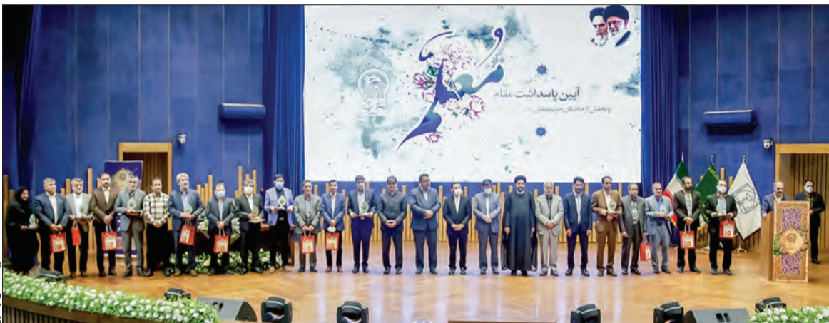
مادر مدرسی مشغول به کار دانش هستیم که منتسب به حضرت رضاع(ع) است، از همین رو رسالت بسیار سنگینی بر دوش داریم؛ ما باید فراتر از نقش معلمی به روح و روان کودکان و آشنایی آنان با آموزه‌های دینی و معارف رضوی توجه کنیم.

به همت بنیاد فرهنگی رضوی در آیینی از ۸۰۰ نفر از معلمان و کارکنان مدارس امام رضا(ع) تجلیل و قدردانی به عمل آمد. عبدالحمید طالبی؛ رئیس سازمان علمی و فرهنگی آستان قدس رضوی در این مراسم که شب گذشته به مناسبت پاسداشت تلاش‌های ارزشمند کارکنان و معلمان مدارس امام رضا(ع) برگزار شد، عنوان