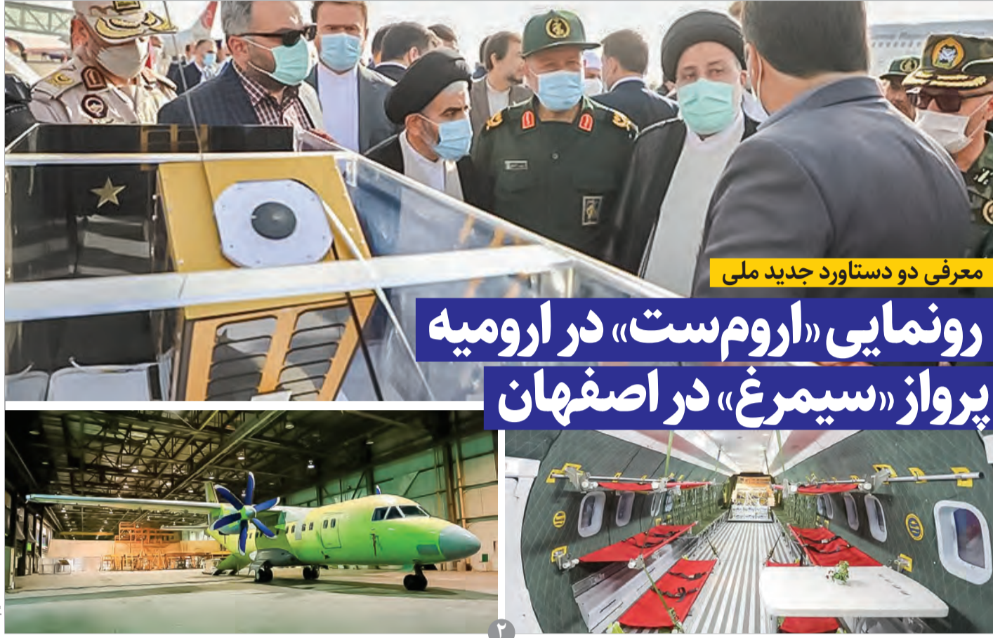
معرفی دو دستاورد جدید ملی