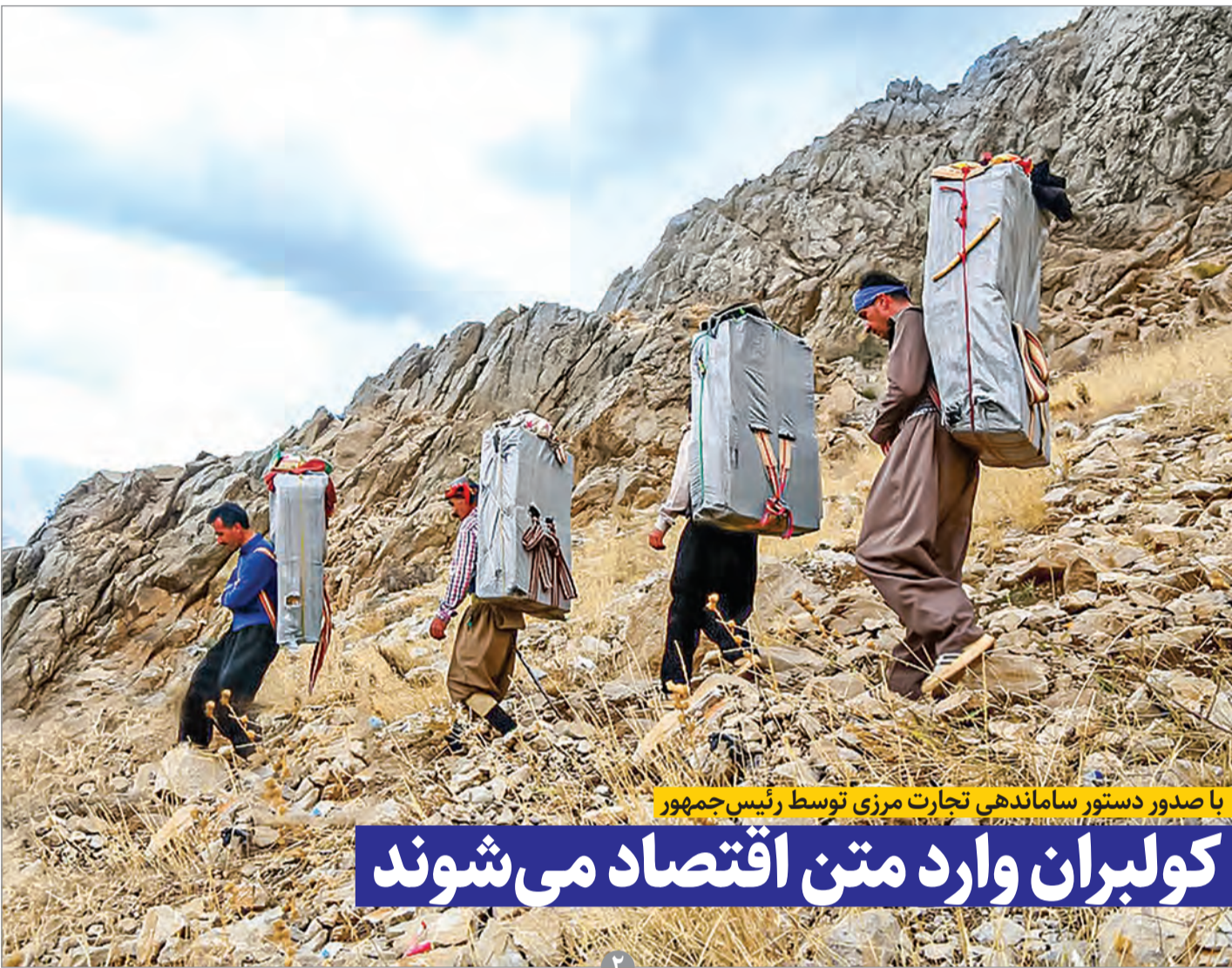
با صدور دستور ساماندهی تجارت مرزی توسط رئیس‌جمهور