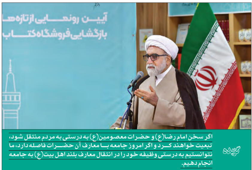
اگر سخن امام رضاع(ع) و حضرات معصومین(ع) به درستی به مردم منتقل شود، تبعیت خواهند کرد و اگر امروز جامعه با معارف آن حضرات فاصله دارد، ما نتوانستیم به درستی وظیفه خود را در انتقال معارف بلند اهل بیت(ع) به جامعه انجام دهیم.

زمان(عج) به من نگاه کند. امام صادق(ع) فرمود: «يَخْرُجُ اللَّهُ مِنْهُ غَوْثٌ هَذِهِ الْأُمَّةُ وَ غِيَاثَهَا»... حرم امام رضاع(ع) که می‌رویم و ضریح منورش را زیارت می‌کنیم، بگوییم: به پسران سفارش کنید بین این خوب‌هایی که می‌آیند به ما هم نگاه کند. اصلاح رابطه ما با امام زمان، می‌تواند به برکت امام رضاع(ع) اتفاق بیفتد. امام رضاع(ع) پناهگاه ماست... یکی از جاهایی که آبرودر خطر است، لحظه‌ای است که می‌خواهند نامه عمل را به دست ما بدهند، حضرت فرمود: آنچه دیگر کسی حق سخن گفتن ندارد. «لَا يَتَكَلَّمُونَ إِلَّا مَنْ أَدْنَى لَهُ الرَّحْمَنُ وَقَالَ صَوَابًا»... لحظه‌ای که می‌خواهند نامه عمل ما را بدهند، تا به کسی اجازه ندهند، نمی‌تواند حرف بزند. امام رضاع(ع) فرمود: هر کسی اینجا بیاید، در خراسان به زیارت من، سه جا به فریادش می‌رسم... هر کس از ترس آبرویش خوف دارد باید بداند وقتی محضر علی بن موسی الرضا(ع) بپیایم، امید داریم آن روز عزیزی، روز بی‌آبرویی، روزی که درون دل‌ها آشکار می‌شود، یوم التبلی السرائر، آنچه امام رضاع(ع) می‌آید و آبروداری می‌کند. یا امام رضاع(ع) محضر شما هستیم و امید داریم روز قیامت در پناه امام رضاع(ع) باشیم.