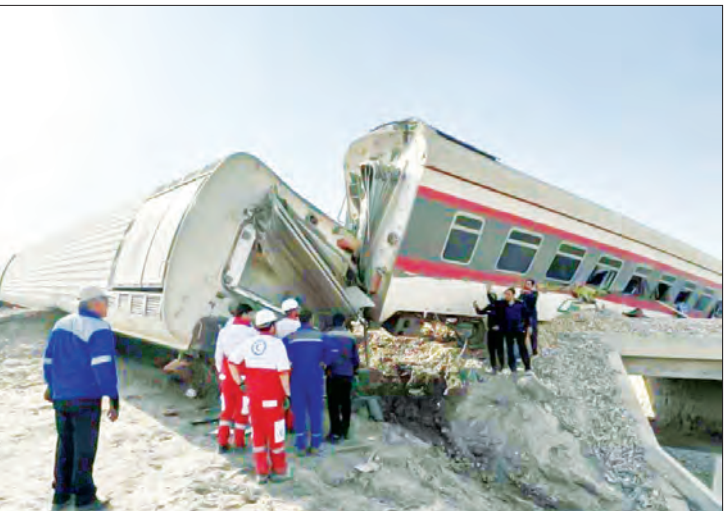
ساعت ۵ و ۳۰ دقیقه بامداد دیروز قطاری که در مسیر مشهد - یزد در حال حرکت بود از ریل خارج شده و بایبل مکانیکی در جوار راه‌آهن بر خورد کرد که منجر به جان باختن ۱۸ نفر و مجروحیت عده‌ای دیگر شد.

تشکیل پرونده قضایی برای حادثه در این راستا دادستان مرکز استان خراسان جنوبی از حضور دادستان شهر طبس در محل وقوع حادثه خروج قطار مسافربری طبس - یزد و تشکیل پرونده قضایی برای بررسی علت وقوع این حادثه خبر داد. حجت الاسلام والمسلمین علی نسایی زهان با بیان اینکه احتمال افزایش تعداد تلفات و فوت شدگان این حادثه وجود دارد،