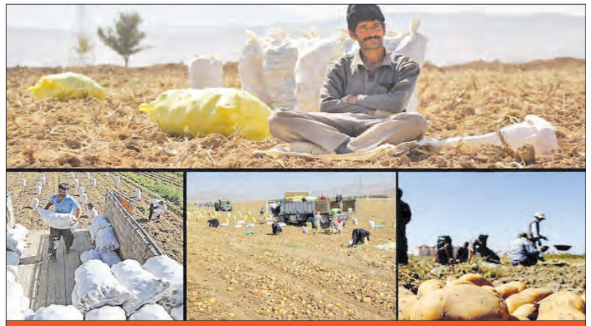
مشکل فعلی، بی‌خبری صادرکننده و شرکت بازرگانی است؛ چون از قبل با خریدار در خارج از کشور، مذاکره کرده و کالای بسته‌بندی و آماده صدور در گمرک قرار دارد غافل از اینکه نرخ عوارض تغییر کرده است.

رئیس کمیسیون صادرات اتاق بازرگانی گرگان هم نسبت به تصمیم دولت برای افزایش یک باره تعرفه صادرات انتقاد می‌کند و می‌گوید: در بخشنامه آمده که به ازای هر کیلو سیب‌زمینی،