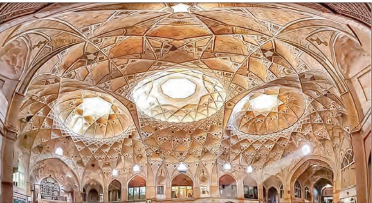
تیمچه قم که یکی از سه تیمچه موجود در شهر قم بوده، بزرگ‌ترین سقف ضریبی ایران و جهان نام نهادند. تیمچه قم دو بخش اصلی تیمچه و سرا دارد که در بخش تیمچه، فضای صحن و حجره‌ها و در بخش سرا نیز کارگاه‌های مختلفی از جمله برای رفوگری فرش قرار دارد.

و مقرنس‌های کم‌نظیرش انسان را مجذوب هنر معماری می‌کند.