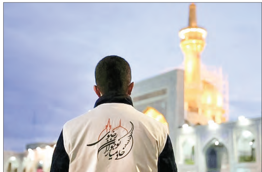
با طرح جذب خادمیاران بیش از ۱۰۰ هزار خادمیاری جذب آستان قدس شده‌اند که از این تعداد بیش از ۸ هزار نفر از استان کرمان هستند. این افراد طبق فعالیت‌هایی که در این عرصه انجام می‌دهند، نوبت تبرکی حرم مطهر را از طریق سامانه جامع خادمیاران دریافت می‌کنند.

وی در حوزه تعلیم و تربیت نیز گفت: با تفاهم‌نامه‌ای که با آموزش و پرورش امضا کردیم