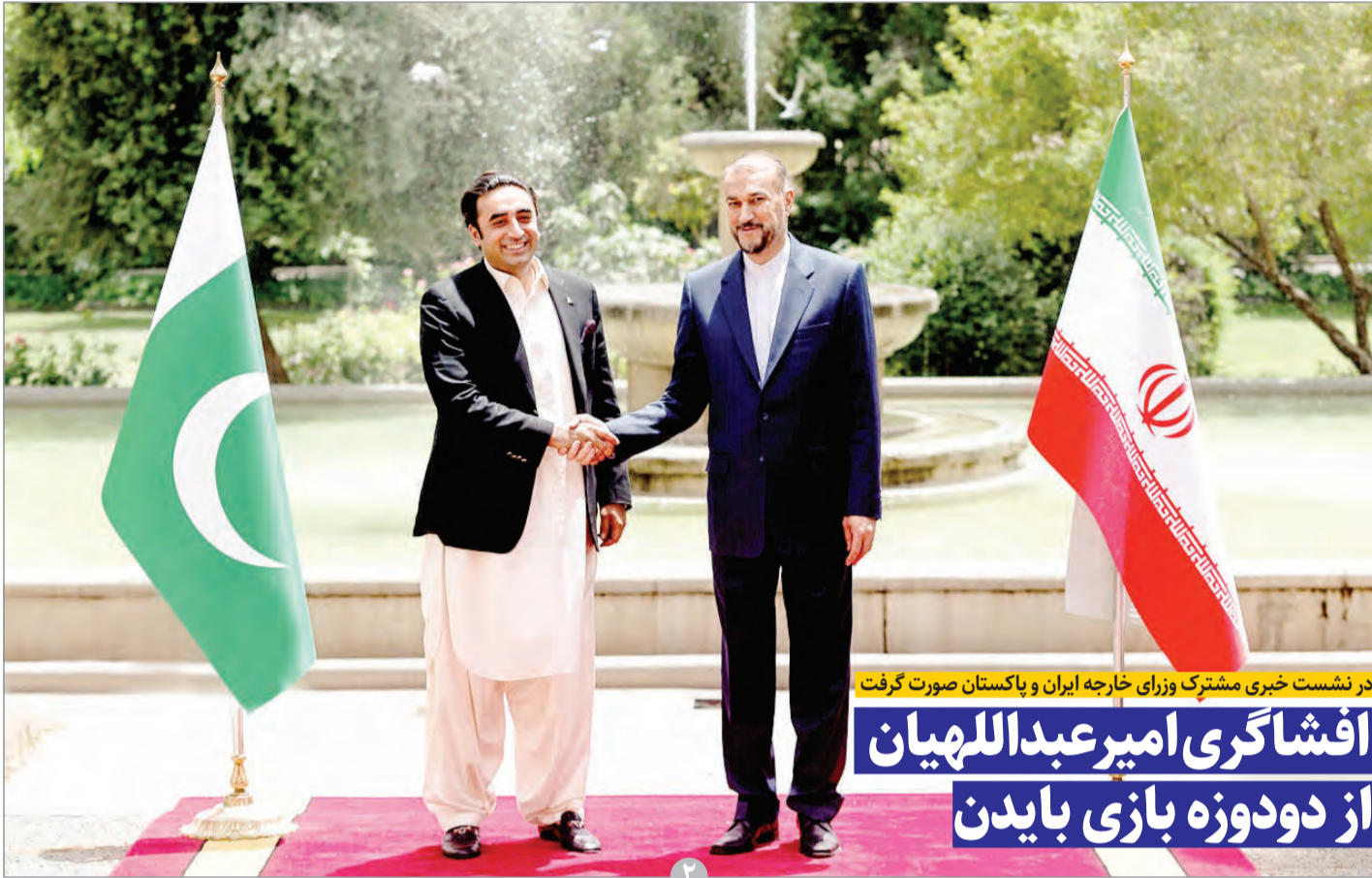
در نشست خبری مشترک وزرای خارجه ایران و پاکستان صورت گرفت افشاگری امیر عبداللهیان از دودوزه بازی بایدن