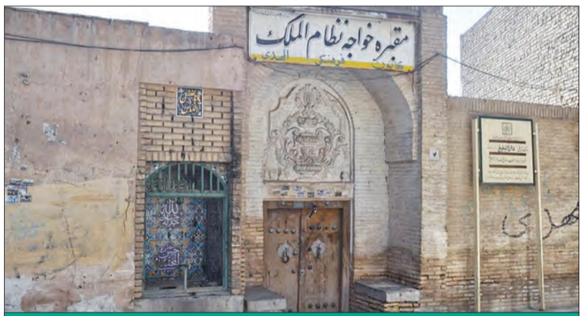
خواجه نظام‌الملک نسبت به عمران و آبادانی مشهد نیز بی تفاوت نبود؛ او را مؤسس چهارباغ مشهور شهر مشهد می‌دانند که طی چند قرن، یکی از محلات بزرگ و مهم شهر بوده است.

نام واقعی خواجه نظام‌الملک، ابوعلی حسن و نام پدرش، ابوالحسن علی بوده است. خاندان خواجه اصالتاً از بزرگ‌زادگان و اشراف منطقه بیهق بودند که از دوران پیش از ظهور اسلام، در این ناحیه نفوذ فراوانی داشتند و بعدها، پیش از تولد خواجه، به مناصب دیوانی طوس رسیدند و به این شهر مهاجرت کردند و او در طوس به دنیا آمد و شهرت طوسی پیدا کرد. از آنجا که منطقه بیهق یکی از مناطق مهم شیعه‌نشین در قرن‌های اولیه اسلامی بوده است و از آن رو که در نام و نسب خواجه نظام‌الملک به اسامی محبوب در نزد شیعیان برمی‌خوریم، برخی از مورخان معتقدند خانواده او گرایش‌های شیعی داشتند؛ هر چند که خواجه در دوران مسئولیت و صدارت، در کلام و نوشتار خود نشانی از این اعتقاد بروز نداده است. پذیرفتن این ادعا، کار ساده‌ای نیست؛ اما می‌توان اثری از محبت و ارادت خواجه به اهل‌بیت(ع) را در تلاش‌های وی برای عمران و آبادی مشهد و حرم رضوی، چنان‌که اشاره خواهد شد، یافت. افزون بر این‌ها، او حرم امام رضا(ع) را مکانی مقدس و محل استنجابت دعا و جایگاه تفکر می‌دانست؛ چنان‌که ملکشاه، مقتدرترین فرمانروای سلجوقی و دست‌پرورده خواجه‌نظام‌الملک، پیش از آنکه تصمیم بگیرد مدعیان را کنار بزند و بر تخت بنشیند، به دعوت خواجه نظام‌الملک شیعی را در حرم امام رضا(ع) و در روضه منوره به عبادت و تفکر پرداخت و پس از