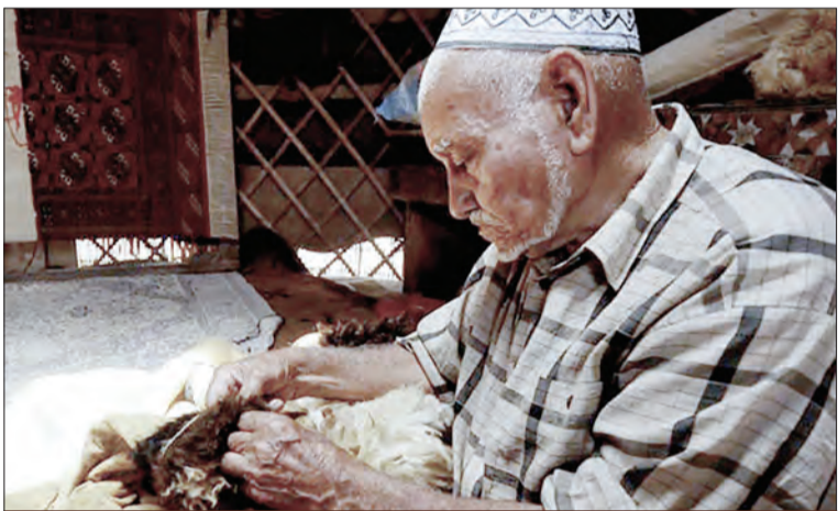
پوستین‌دوزی در حال حاضر یکی از حرفه‌هایی است که در استان گلستان، مردان ترکمن بدان اشتغال دارند. این جامعه که در زبان ترکمنی به آن «او چمک» گفته می‌شود، یکی از بالا پوش‌های گرمابخش بوده و مورد استفاده چوپانان و صحرانشینان قرار می‌گیرد.

پوستین‌دوزی در حال حاضر یکی از حرفه‌هایی است که در استان گلستان، مردان ترکمن بدان اشتغال دارند. این جامعه که در زبان ترکمنی به آن «اوچمک» گفته می‌شود، یکی از بالا پوش‌های گرمابخش بوده و مورد استفاده چوپانان و صحرانشینان قرار می‌گیرد. در این منطقه، هوای سرد و دام فراوان، دلیلی برای به وجود آمدن پوستین و پوستین‌دوزی شده است. ترکمن‌ها برای تولید پوستین، پوست گوسفندان دارای پشمی یکرنگ و مناسب را جمع‌آوری می‌کنند. فرایند عمل‌آوری پوستین شامل خیساندن، شست‌وشو، درجه‌بندی، آرزیم‌دهی، رنگ‌برداری، خشک‌کردن، رنگ‌ریزی، واکس و در نهایت تثبیت است.