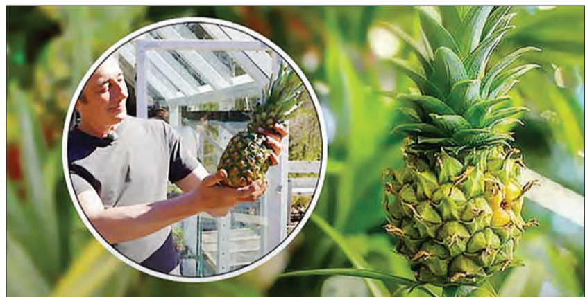
اصفهان در سال‌های گذشته با توسعه گلخانه‌ها توانسته بخشی از بازار داخلی را به اسم خود ثبت کند و با نیم‌نگاهی به بازارهای جهانی، در راه پیشرفت این صنعت نیز تلاش کند.

وی افزود: توسعه کشت محصولات گلخانه‌ای در حال حاضر نزدیک به ۲ هزار و ۴۰۰ هکتار رسیده است. با توجه به شرایط کم‌آبی و کم‌بارشی که در استان و برخی نقاط کشور وجود دارد، ایجاد اشتغال، افزایش تولید در واحد سطح، استفاده بهینه از آب کشاورزی، صادرات محصولات گلخانه‌ای و ارزآوری