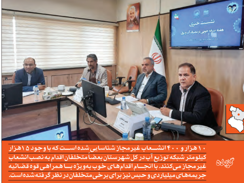
۱۰ هزار و ۴۰۰ انشعاب غیرمجاز شناسایی شده است که با وجود ۱۵ هزار کیلومتر شبکه توزیع آب در کل شهرستان بعضاً متخلفان اقدام به نصب انشعاب غیرمجاز می‌کنند. با انجام اقدام‌های خوب به ویژه با همراهی قوه قضائیه جریمه‌های میلیاردی و حبس نیز برای برخی متخلفان در نظر گرفته شده است.

مدیرعامل شرکت آب منطقه‌ای خراسان رضوی گفت: جایگزینی پساب برای آبیاری مزارع کشاورزی و نیز رایزنی با کشورهای همسایه از جمله ترکمنستان و تاجیکستان برای تأمین آب از این کشورها که در مرحله مطالعات است از جمله منابعی است که در آینده به چرخه تأمین آب استان اضافه خواهند شد. وی درخصوص آخرین وضعیت ساخت سد شور ریجه بیان کرد: این سد در حال حاضر ۲۹ درصد پیشرفت فیزیکی دارد که تا دو سال دیگر این سد آماده بهره‌برداری خواهد شد.