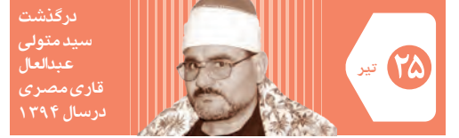
تیر ۲۵ درگذشت سید متولی عبدالعزیز قاری مصری در سال ۱۳۹۴