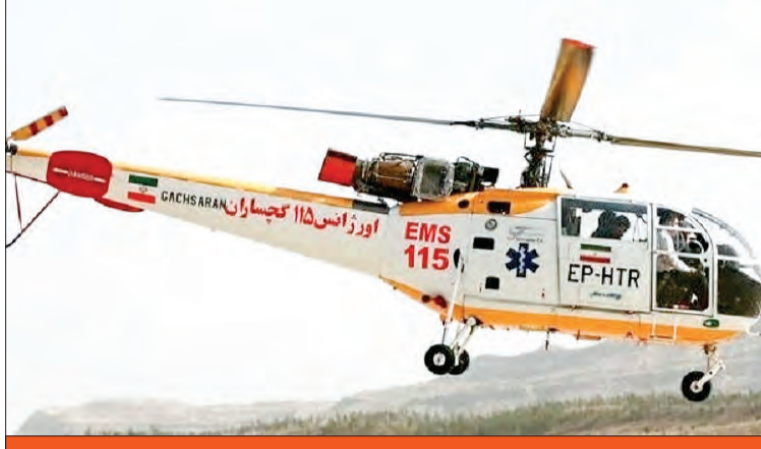
خلا ناشی از پیش‌بینی نشدن پد فرود برای بالگرد در مکان‌های بیمارستانی استان کهگیلویه و بویراحمد از جمله عواملی است که اورژانس هوایی استان را در انجام موفق مأموریت‌هایش در تنگنا قرار داده است.