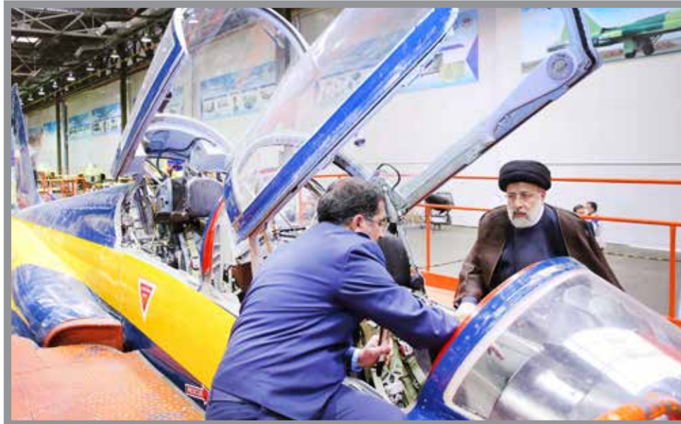
رئیس جمهوری معتقد است که ایران تایک قدمی ساخت هواپیمای مسافربری رسیده است