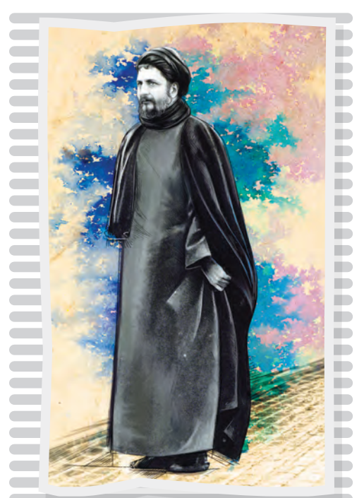
واکوی اندیشه‌های امام موسی صدر همزمان با سالروز ریایش او خدا عشقش کشید او را خلق کند