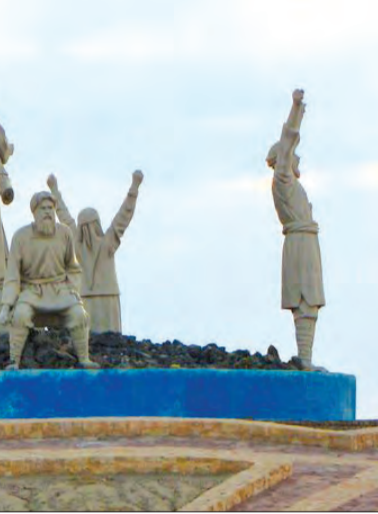
نخستین ایام سربداران در سروزار

فصیح احمد خوافی، مورخ و ادیب قرن هشتم و نهم هجری، در کتاب مشهور «مجمل فصیحی»، برای آغاز قیام سربداران، روایتی شورانگیز را نقل کرده است: «در نهم یا دوازدهم شعبان سال ۷۳۶ یا ۷۳۷ هجری، پنج ایلیی مغول در خانه حسین حمزه و حسن حمزه از مردم قریه باشتین منزل کردند و از ایشان شراب و شاهد طلبیدند و لجاج کردند و بی حرمتی نمودند. یکی از دو برادر قدری شراب آورد، وقتی که ایلیچیان مست شدند، شاهد طلبیدند و کار فضاحت را به جایی رساندند که عورات (محارم و همسران) ایشان را خواستند. دو برادر گفتند دیگر تحمل این ننگ را نخواهیم کرد. بگذار «سر ما به دار» رود. شمشیر از نیام برکشیدند. هر پنج تن مغول را کشتند و از خانه بیرون رفتند و گفتند ما سر به دار می‌دهیم، اما تن به ذلت هرگز». جنبش سربداران، نخستین جنبش شیعه امامیه در دوران غیبت بود که به تأسیس یک حکومت انجامید؛ حکومتی که بین سال‌های ۷۳۶ تا ۷۸۸ قمری دوام آورد. هرچند شیعیان، پیش از این تاریخ نیز، موفق به تأسیس حکومت شده بودند؛ آل بویه، دودمانی ایرانی از اهالی دیلمان و گیلان، مذهب شیعه داشتند و بر عراق و ایران غربی حکم راندند یا فاطمیان که شیعه اسماعیلی بودند، دیر زمانی حکومت خود را در مصر و بخش‌هایی از شام بر پا نگه داشتند