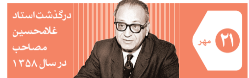
درگذشت استاد غلامحسین مصاحب ۱۳۵۸

WWW.QUDSONLINE.IR چشمه ۱۴۰۱ ربيع الاول ۱۴۴۴ ۱۳۲۲ شمير ۲۰۲۲ سال سي و پنجم صفحه ۴ صفحه رواق ۴ صفحه ویژه خراسان قیمت در مشهد و تهران ۳۰۰۰ تومان - سایر مناطق کشور ۲۰۰۰ تومان