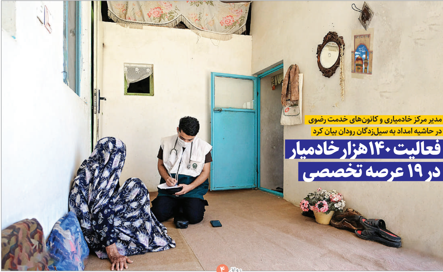
مدیر مرکز خدامیاری و کانون های خدمت رضوی در حاشیه امداد به سیل زدگان رودان بیان کرد

فعالیت ۱۴۰ هزار خادمیاری در ۱۹ عرصه تخصصی