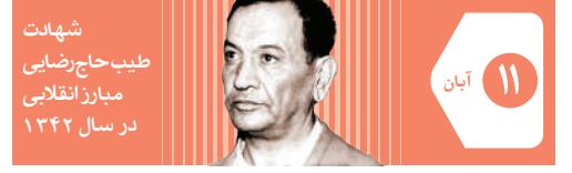
شهادت طبیب حاج رضایی مبارز انقلابی در سال ۱۳۴۲