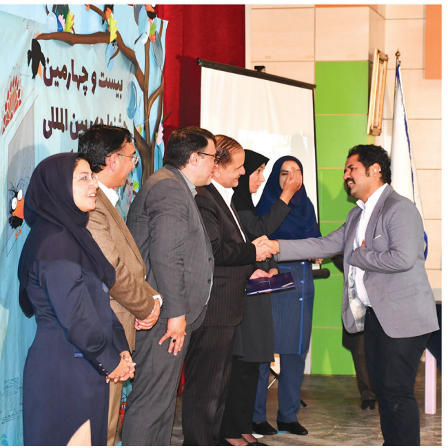
رپورتاژ آگهی ۱۴۰۱/۰۷/۰۴