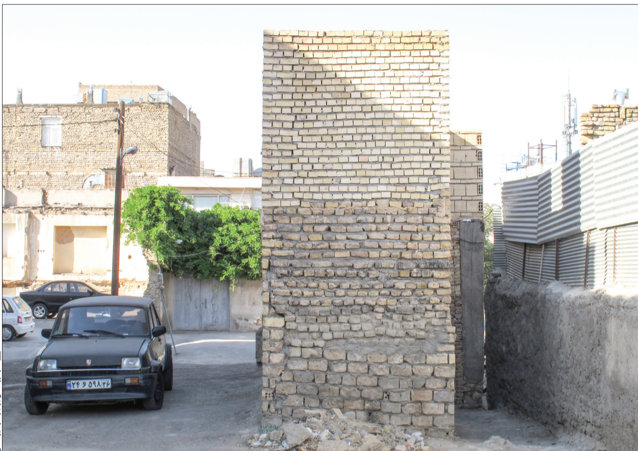
فرمانده عملیات ویژه - آرشید - آرشید

مدیر عامل سازمان بازرسی فضاهای شهری با اشاره به قطع همکاری با شرکت های غیر بومی در دفاتر تسهیل گری: